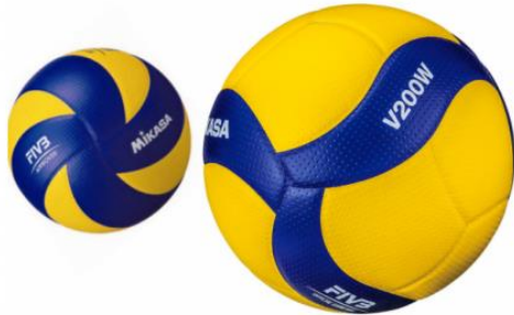
Mikasa V200W tilbud